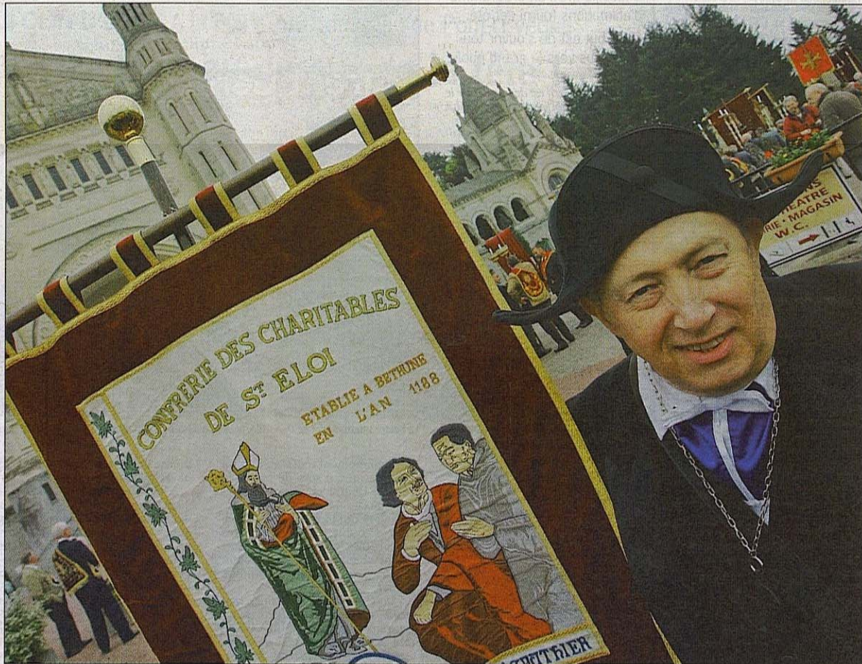
Quelque 500 charitons du pays d'Auge se sont réunis le week-end dernier à la basilique de Lisieux. Remise de médailles, messes, échanges... ont été à l'ordre du jour de cette rencontre.