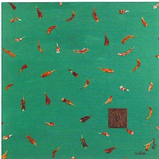
aire de los andes iii

imaginación interior más libre. Remembranza de la niñez y del placer de las cajas de música de cuando tomábamos té en las rodillas de la abuela.